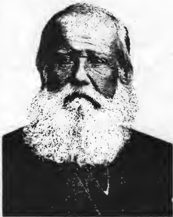
D. Pedro II, no período final do Império.

Na verdade, a raça negra cooperara grandemente para a formação do Brasil. Num discurso notável, Joaquim Nabuco pintara com mão de mestre o panorama dessa colaboração fecunda. O suor africano fecundara o solo; o